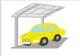
カーポートを設置