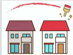
外観の色彩を変更