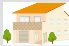
バルコニーを設置