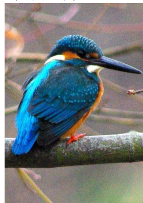
甲府市の鳥 カワセミ

川の土手や水辺にすむ留鳥(死ぬまでうまれた土地を離れない野鳥)で、背羽根の美しさから「飛ぶ宝石」とも言われます。「宝石の街・甲府」に1番ふさわしいと選ばれました。(昭和59年8月指定)