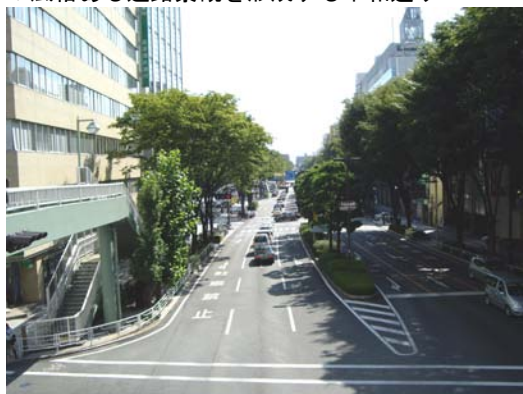
▼風格ある道路景観を形成する平和通り