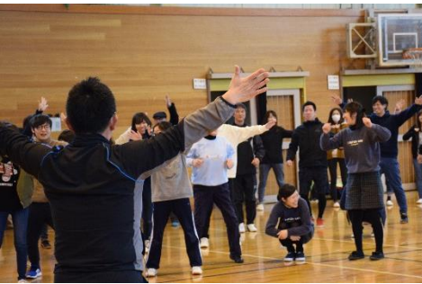
■ 眞砂野先生の実技研修では、アイスブレイクの「じゃんけん」からスタート。