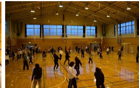
■ 身近にあるものを使い、工夫することで存分に遊べることを学びました。