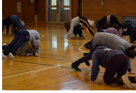
■ 体に力を入れる感覚を知る遊びや様々な動き方を経験できる遊びを行いました。