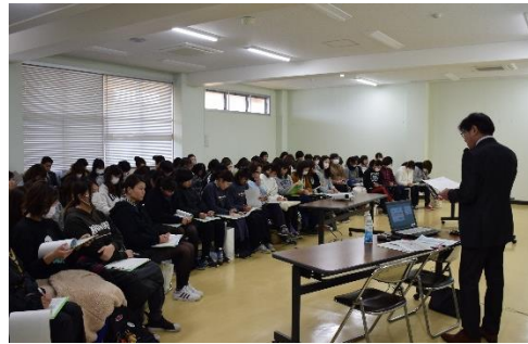
■ 多くの方に受講していただきました。