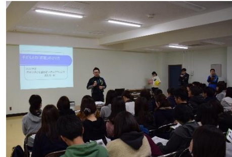
■ 最後に、実技内容を振り返り、全員で理解を深めました。