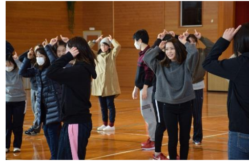
■ 移動方法を工夫した鬼ごっこを実践。いつものと違う鬼ごっこで、みんな笑顔に。