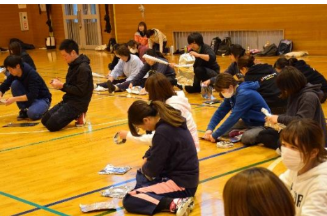
■ 身近にある、新聞紙やアルミホイルを使った遊び道具作りに、興味津々です。