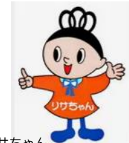
甲府市ごみ減量キャラクター リサちゃん